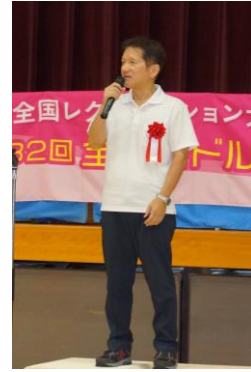
泉鳴門市市長による来賓挨拶