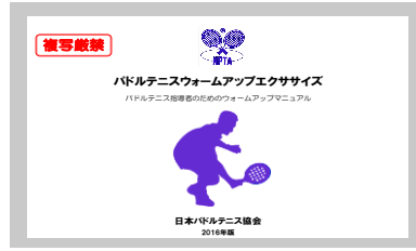
ウォームアップエクササイズ