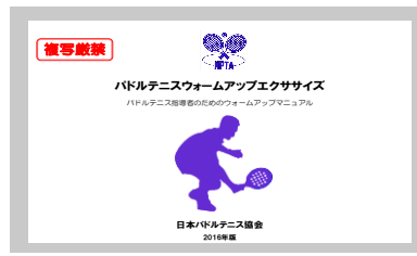
ウォームアップエクササイズ